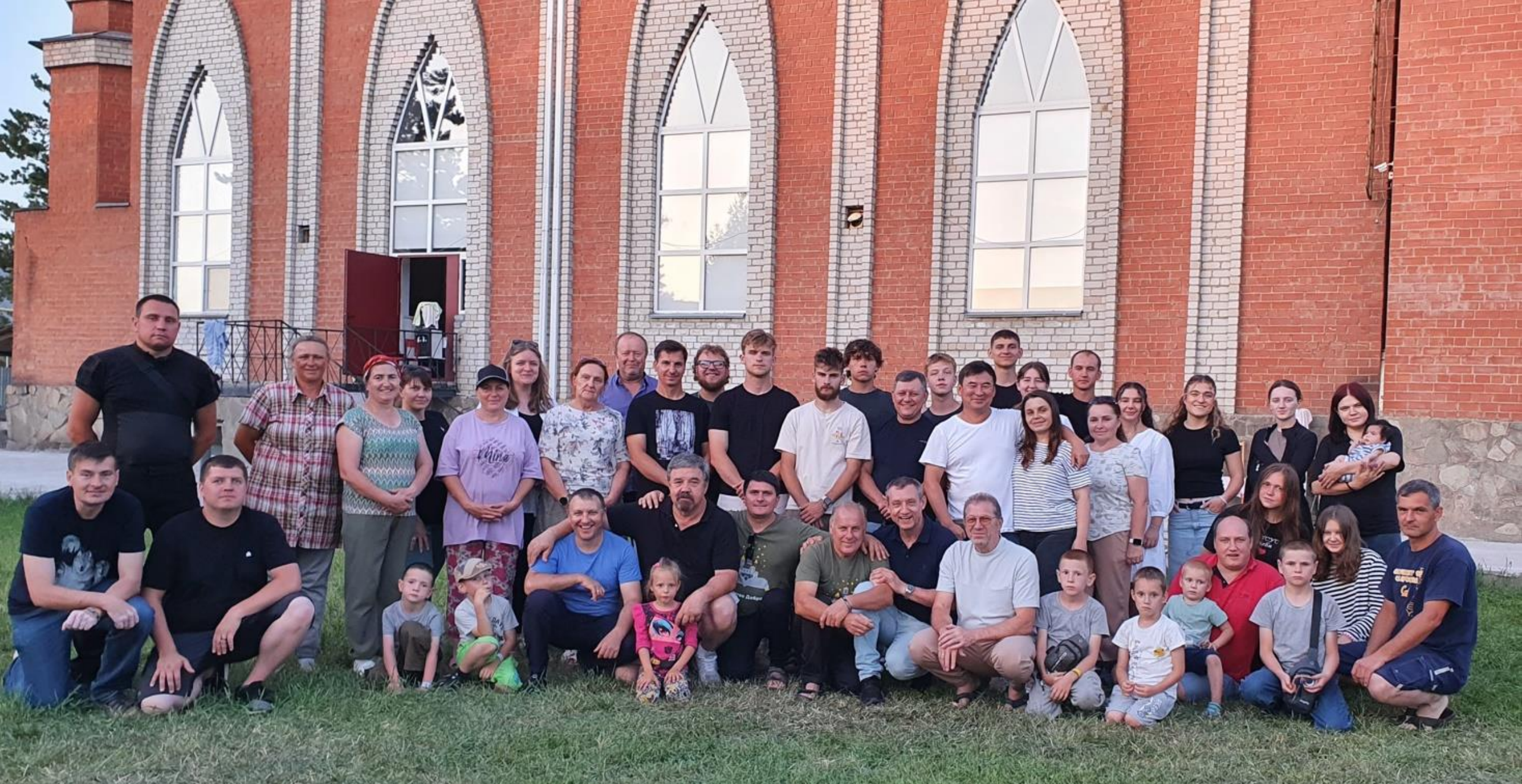
Ein Gruppenbild mit der Gemeinde und mit einigen Mitarbeitern.